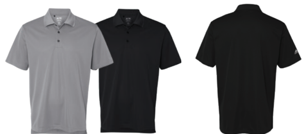
Grey Three Gris Three