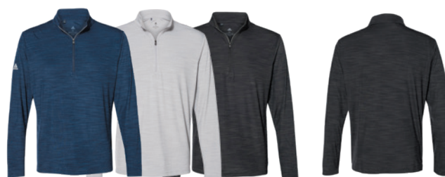
Collegiate Navy Mélange Mélange Marine Collegiate Mid Grey Mélange Mélange Gris Moyen Black Mélange Mélange Noir Back Dos