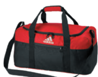
Collegiate Red/Black Rouge Collegiate/Noir