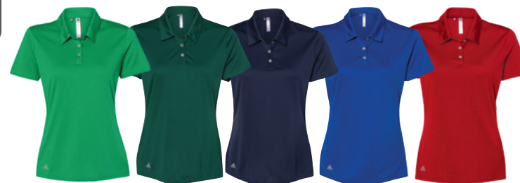
Green Vert Collegiate Green Vert Collegiate Navy Marine Collegiate Royal Royal Collegiate Collegiate Red Rouge Collegiate