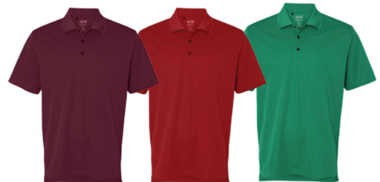
Collegiate Burgundy Bourgogne Collegiate