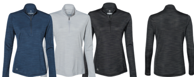
Collegiate Navy Mélange Mélange Marine Collegiate Mid Grey Mélange Mélange Gris Moyen Black Mélange Mélange Noir Back Dos