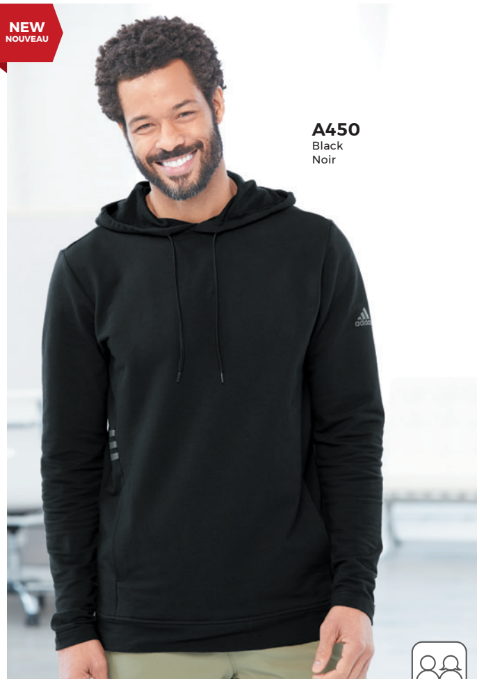
A450 Black Noir