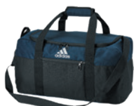
Collegiate Navy/Black Marine Collegiate/Noir