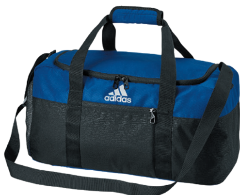
Collegiate Royal/Black Royal Collegiate/Noir