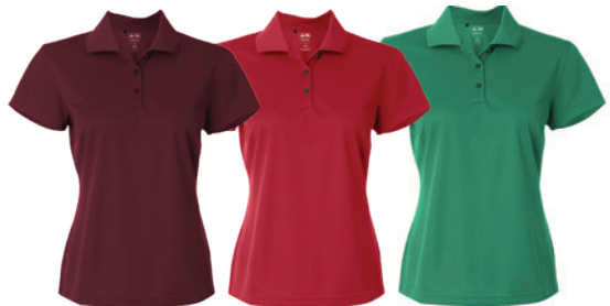
Collegiate Burgundy Bourgogne Collegiate