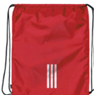
Collegiate Red Rouge Collegiate