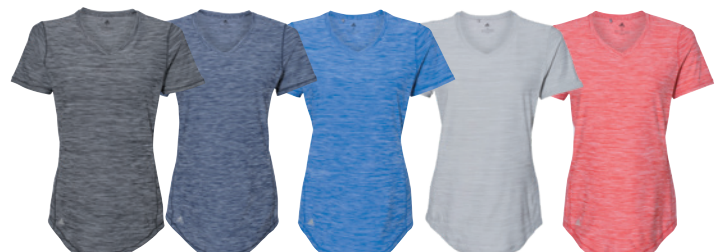
Black Mélange Mélange Noir Navy Mélange Mélange Marine Collegiate Royal Mélange Mélange Royal Collegiate Mid Grey Mélange Mélange Gris Moyen Collegiate Red Mélange Mélange Rouge Collegiate