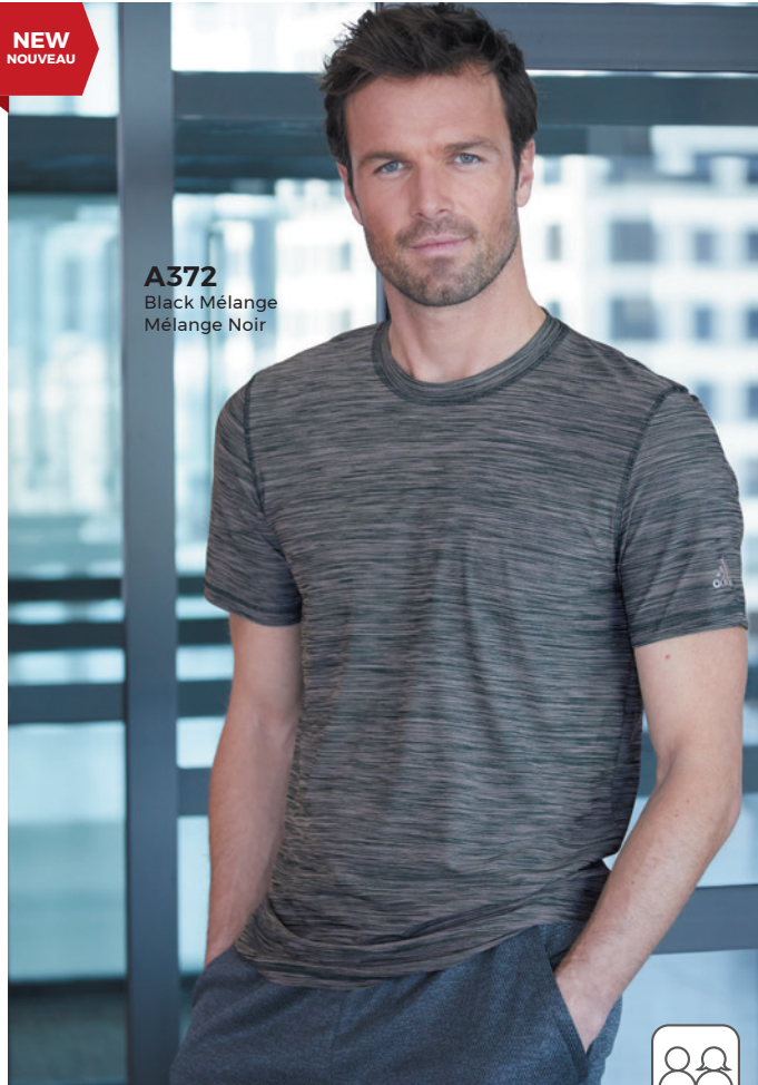
A372 Black Mélange Mélange Noir