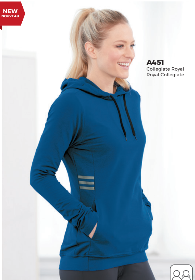
A451 Collegiate Royal Royal Collegiate