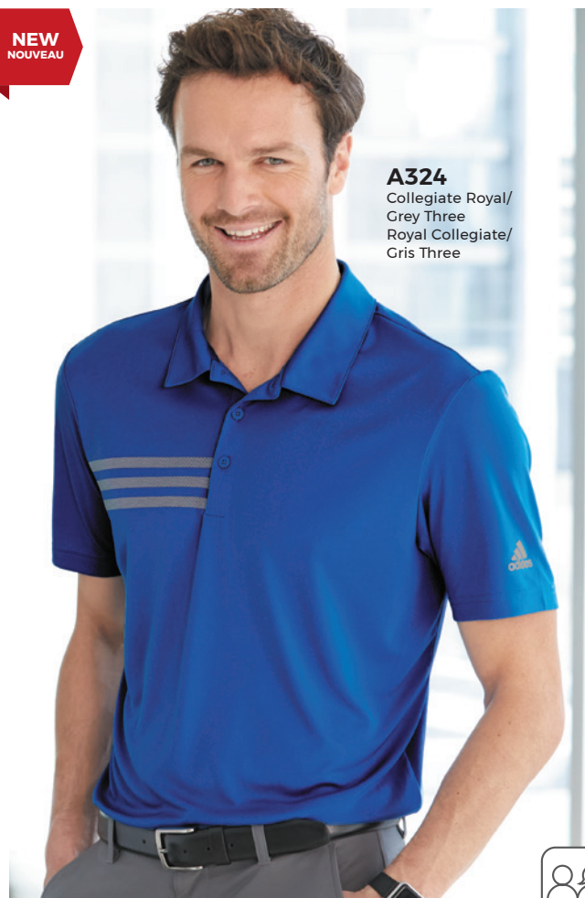
A324 Collegiate Royal/ Grey Three Royal Collegiate/ Gris Three