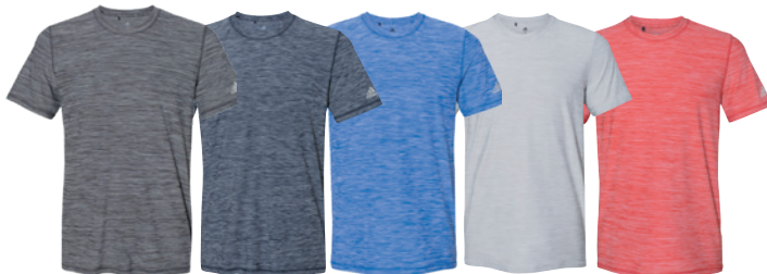
Black Mélange Mélange Noir Navy Mélange Mélange Marine Collegiate Royal Mélange Mélange Royal Collegiate Mid Grey Mélange Mélange Gris Moyen Collegiate Red Mélange Mélange Rouge Collegiate