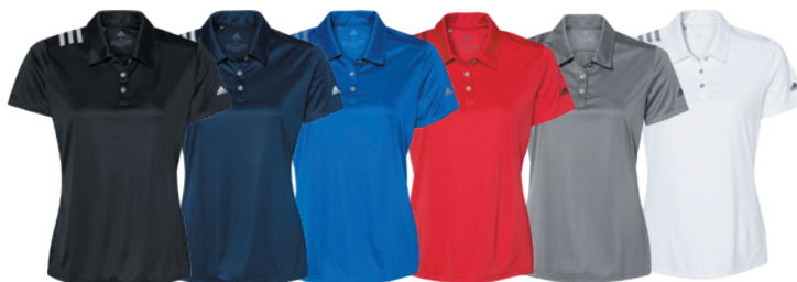
Black/White Noir/Blanc Collegiate Navy/White Marine Collegiate/ Blanc Collegiate Royal/ Grey Three Royal Collegiate/ Gris Three Collegiate Red/Black Rouge Collegiate/ Noir Grey Five/Black Gris Five/Noir White/Black Blanc/Noir