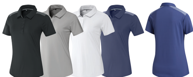
Black Noir Solid Grey Gris Solide White Blanc Tech Indigo Indigo Tech Back Dos