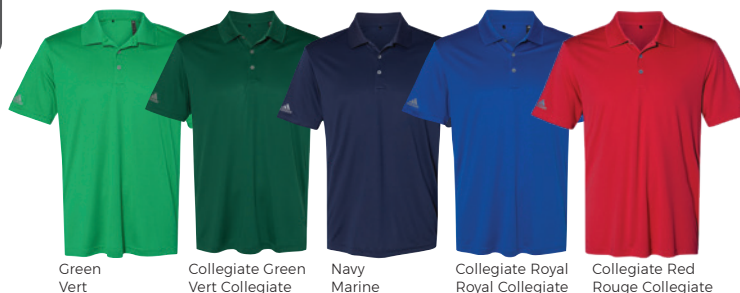
Green Vert Collegiate Green Vert Collegiate Navy Marine Collegiate Royal Royal Collegiate Collegiate Red Rouge Collegiate