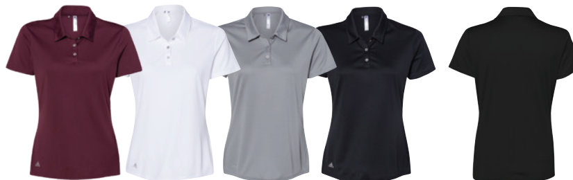
Maroon Marron White Blanc Grey Three Gris Three Black Noir Back Dos