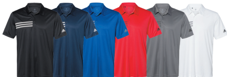
Black/ White Noir/Blanc Collegiate Navy/White Marine Collegiate/ Blanc Collegiate Royal/ Grey Three Royal Collegiate/ Gris Three Collegiate Red/Black Rouge Collegiate/ Noir Grey Five/Black Gris Five/Noir White/Black Blanc/Noir