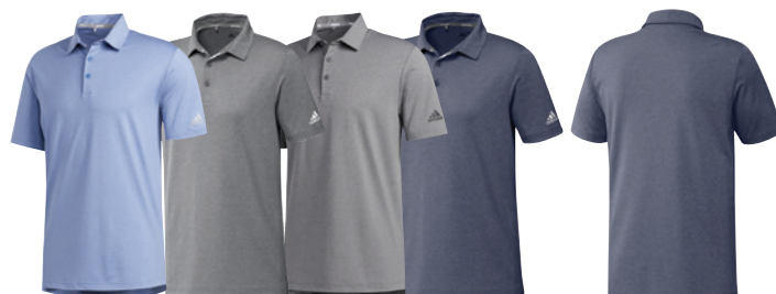
Trace Royal Mélange Grey Three Heather/White Cris Three Grey Five Heather/Black Cris Five Collegiate Navy Mélange Mélange Marine Collegiate Back Dos