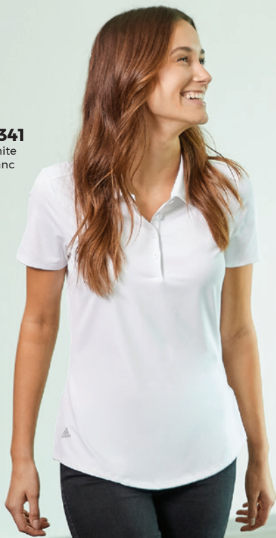
A341 White Blanc