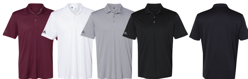
Maroon Marron White Blanc Grey Three Gris Three Black Noir Back Dos