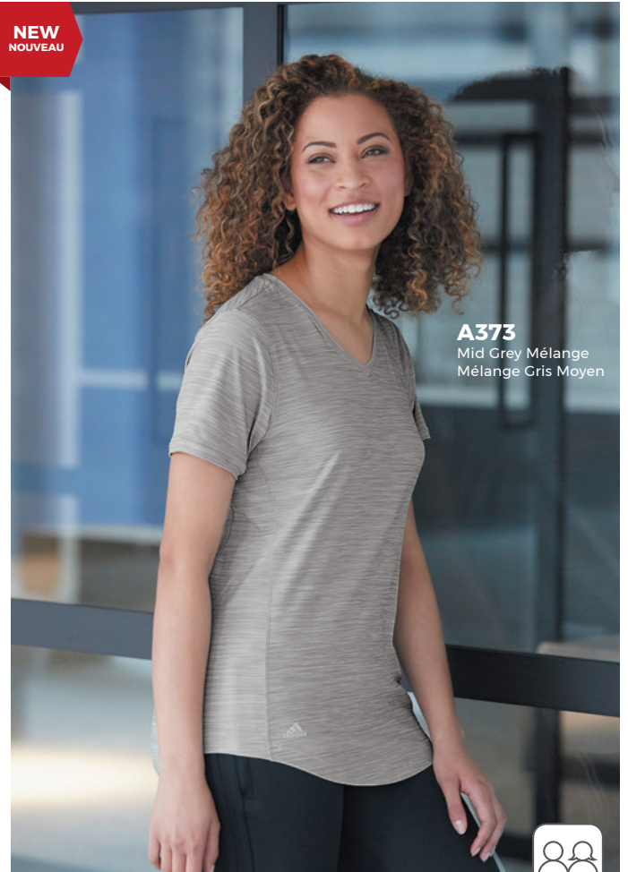
A373 Mid Grey Mélange Mélange Gris Moyen