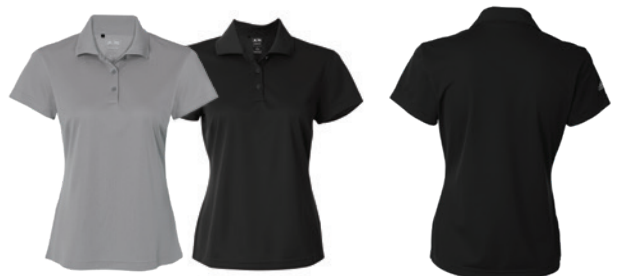
Grey Three Gris Three