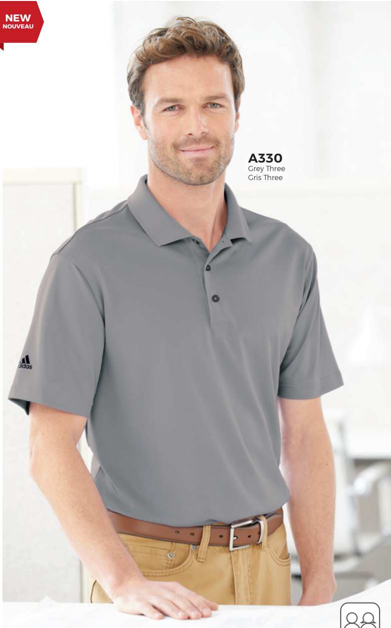
A330 Grey Three Gris Three